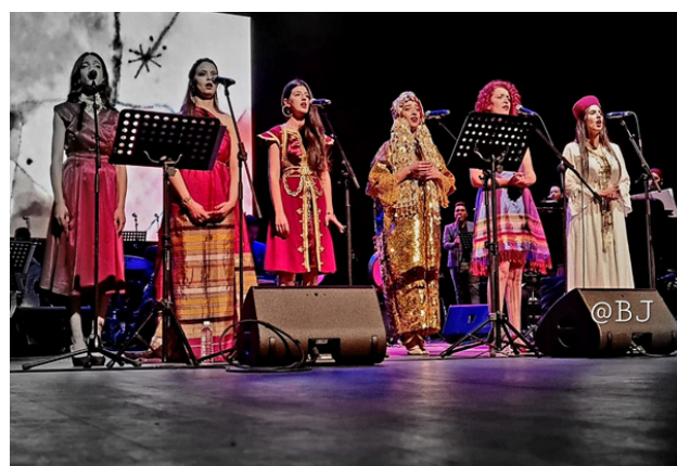
ENSEMBLE DE LA HADHRA FÉMININE, OPÉRA DE TUNIS, 2022