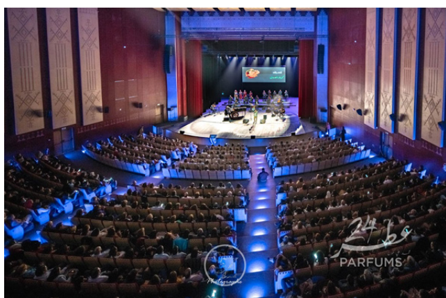
THEATRE DE L'OPERA TUNIS, 2019