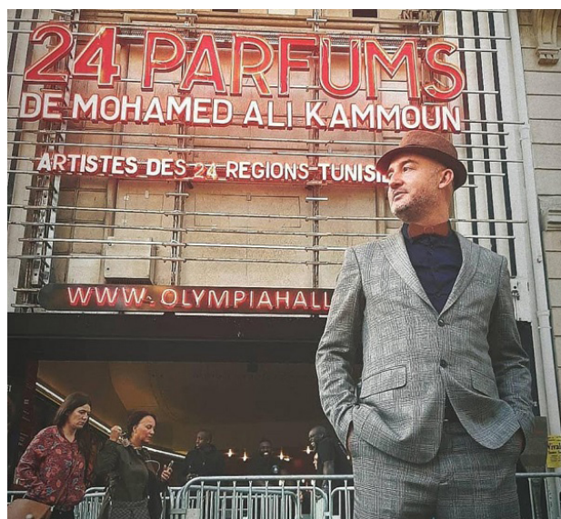
L'OLYMPIA DE PARIS 2019