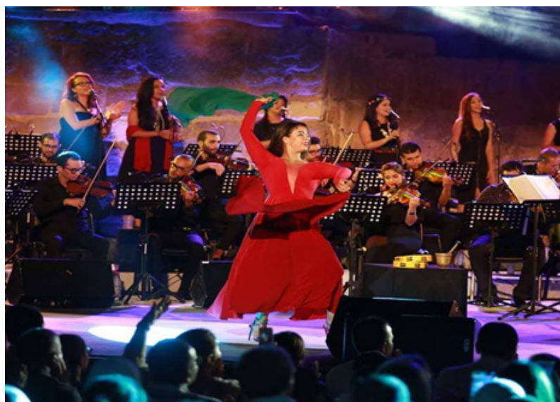
CLOTURE DU FESTIVAL INTERNATIONAL DE CARTHAGE 2018

La première du spectacle a eu lieu le 17 août 2018 à la clôture du Festival International de Carthage en présence de 60 artistes. Une vingtaine de concerts ont eu lieu pendant la tournée de 2019, la plupart à l'ouverture ou à la clôture de festivals internationaux. Le 19 septembre un concert mythique à guichet fermé a été donné à la salle légendaire de l'Olympia de Paris (19 Septembre 2019).