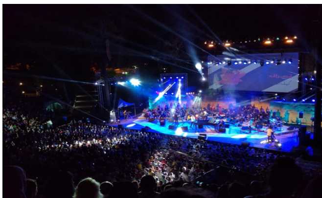
CLÔTURE DU FESTIVAL INTERNATIONAL DE CARTHAGE 2018 (LA PREMIERE DU SPECTACLE)